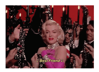
puc.3 GentlemenPreferBlondes / 20thCenturyFox, 1953 (новость «Алмазы сформировались из океанского дна», nplus1.ru

Таким образом, можно отметить, что принципиальным отличием sciencenews в научно-популярных медиа является их независимость от федеральной новостной повестки и ориентация на более подготовленную аудиторию. Как следствие, при организации многоуровневого текста адресанты обладают большей свободой в подаче информации, могут изменить привычное расположение структурных частей (например, бэкграунда) или подобрать иллюстрацию в виде мема. При этом сам текст новости отличается большей терминологической наполненностью, а обязательным условием является прямая ссылка на оригинальное исследование, по которому и была написана новость.